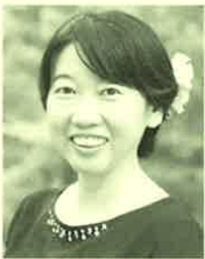
小野税務会計事務所 所長 税理士